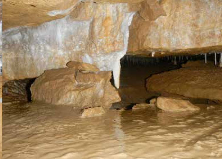
Höhle und Karst