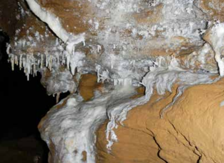
Gestaltung: nanagrafik Höhle und Karst