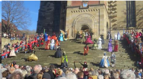
und an der Kirchentreppe