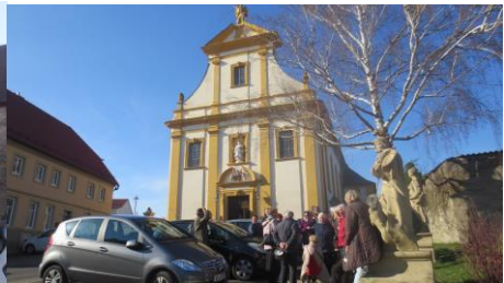
Schutzengelkirche in Gaukönigshofen

benachbarten Gaukönigshofen die Mesnerin der Schutzengelkirche, die viel Interessantes über die 1724 bis 1730 erbaute Kirche zu erzählen wusste. Oben auf der Fassade befindet sich ein riesiger vergoldeter Engel, der ein kleines Kind beschützt.