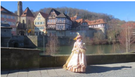
Bunte Masken am Kocher

Der Start im Januar erfolgte mit einem Besuch der Bäckerei Weber in Königshofen. Der Firmenchef selbst führte seine Besucher durch die Produktions- und Versandstätten seines Betriebes. Eindrucksvoll und engagiert zeigte er seinen Besuchern die Herstellung von Brot, Brötchen und süßem und salzigem Gebäck. Zum Schluss durfte auch noch probiert werden.