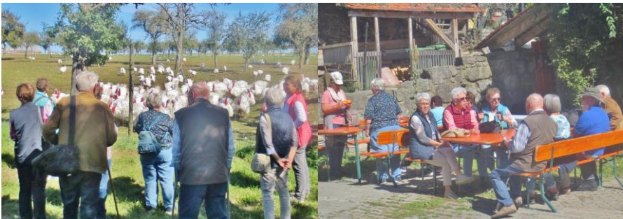
Bei der Puten- und Hähnchenzucht des Brunnenhofes in Mäusdorf

Die beiden Sommermonate verbrachten die „Grauen Füchse“ sehr entspannt bei geselligem Beisammensein. Im Juli traf man sich wieder zum Kneippen und Sommerpicknick am Generationenpfad bei Dörzbach. Das Grillen an der Geinhartsberghütte mit seinen launigen Sketschen ist bereits eine jahrelange Tradition im August.