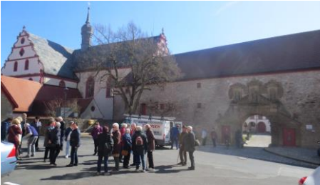
Kartäuserkloster in Tüchelhausen

Der März bescherte den Senioren der Naturschutzgruppe eine Doppelbesichtigung. Zuerst wartete in Tüchelhausen auf die Besucher eine Führerin, die der Gruppe den Außen- und Innenhof sowie die ehemaligen Wohnanlagen der Mönche des 1803 aufgelösten Klosters zeigte. Im Museum erfuhren die Teilnehmer viel Wissenswertes über den Kartäuserorden und seine Mönche. Anschließend traf die Gruppe im