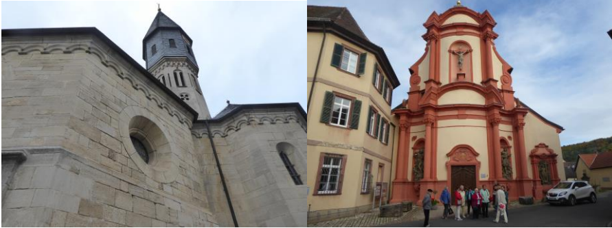
Die Achatius-Kapelle in Grünfeldhausen Klosterkirche in Gerlachsheim

Der Besuch der Puten- und Hähnchenzucht in Mäusdorf bei Künzelsau im September hatte wieder das Thema Ernährung. Das Betreiberehepaar des Brunnenhofes informierte bei einem Rundgang sehr kompetent und authentisch über den Werdegang und die aktuellen Arbeiten und Angebote ihres Demeter Betriebes. Abschließend konnten einige sehr leckere Produkte probiert werden.