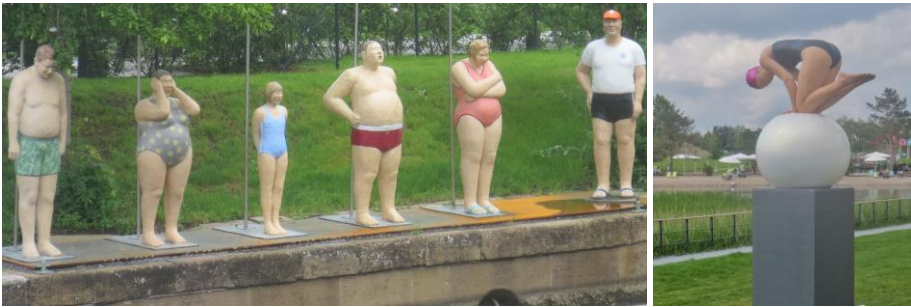
Blumen und Pflanzen, aber auch sportliche Skulpturen erfreuten die Besucher.

Schloss ausgebaut. Sie enthält heute neben dem Hohenloher Zentralarchiv auch viele wertvolle Möbel, Bilder und interessante Gerätschaften.