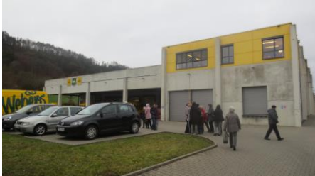
Königshofer Bäckerei Weber

Im abgelaufenen Jahr 2019 ist bei der Seniorengruppe alles wie geplant abgelaufen. Zu den Monatstreffen im Umweltzentrum kamen wie gewohnt zwischen 10 und 15 Teilnehmer. Bei der Planung Anfang des Jahres für die 12 monatlichen Veranstaltungen hat das Leitungs-Team seine bemerkenswerte Kreativität bewiesen. Es entstand ein sehr interessantes Programm, das insgesamt von über 250 (im Durchschnitt 21) Teilnehmern sehr gut angenommen wurde. Insgesamt machten die Grauen Füchse 10 Ausflüge mit Fahrgemeinschaften in die nähere oder etwas weitere Umgebung mit dem Bus. Im Sommer und im Winter wurde vor Ort gesellig gegessen und gefeiert.