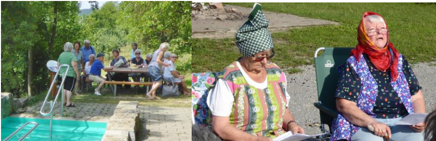
Kneipen bei Dörzbach „Grilltheater“ bei der Geinhartsberghütte

Der Ohrenbacher Bürgermeister persönlich zeigte seinen Gästen kompetent die Reste der Kommende und die teilweise erhaltene Wallfahrtskirche und warb auch für die lohnenswerten beiden Geschichtsrundwege um Reichardsroth und den Glaubensweg durch Ortsteile von Ohrenbach.