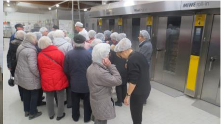
Besuch der Backofenzeile

Der Start im Januar erfolgte mit einem Besuch der Bäckerei Weber in Königshofen. Der Firmenchef selbst führte seine Besucher durch die Produktions- und Versandstätten seines Betriebes. Eindrucksvoll und engagiert zeigte er seinen Besuchern die Herstellung von Brot, Brötchen und süßem und salzigem Gebäck. Zum Schluss durfte auch noch probiert werden.