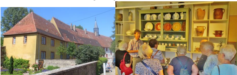
Im Auber Spital wurden Arme nach sieben Werken der Barmherzigkeit gepflegt

Für den 22.Mai stand der Besuch der Bundesgartenschau in Heilbronn auf dem Programm. Die Zahl der Anmeldungen zu dem Ganztagesausflug reichte in diesem Jahr nicht, um wie gewohnt einen eigenen Reisebus zu füllen. Es regnete bei der Ankunft in Heilbronn Bindfäden. Das hielt aber niemanden ab, sich dieser sehr gelungenen Ausstellung rund um den Garten zu widmen. Gegen Mittag zeigte sich die Sonne und beleuchtete das farbenprächtige Blumenmeer bis zur Abfahrt des Busses.