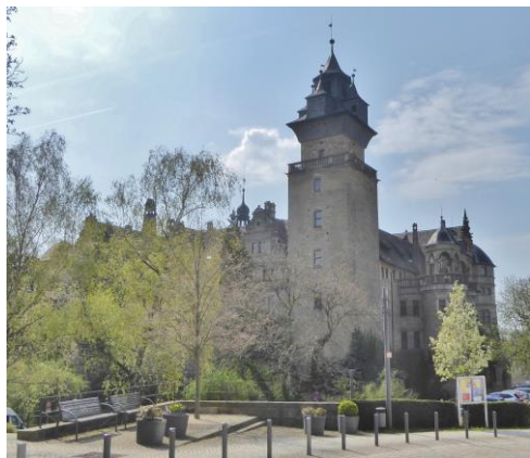
Renaissance-Schloss der Fürsten von Hohenlohe in Neuenstein.

Im April besuchten die Senioren der Naturschutzgruppe die Residenz der Fürsten von Hohenlohe im Schloss in Neuenstein. Die ehemalige Wasserburg wurde im 16. Jahrhundert als Regierungssitz einer Hauptlinie des Hauses zu einem Renaissance-