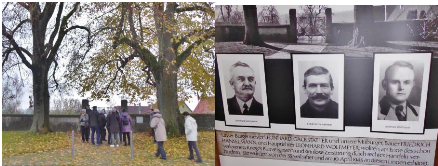
Gedenkstelle der Männer von Brettheim

Im Oktober sollten eigentlich die Oktogonkapellen St. Sigismund in Oberwittighausen (um 1150) und St. Achatius in Grünfeldhausen (um 1200) besucht werden. Über St. Achatius-Kapelle erhielten die Grauen Füchse im frisch renovierten Gotteshaus einen sehr interessanten Vortrag. Der Besuch in Oberwittighausen hat nicht geklappt, dafür konnte durch die Klosterkirche Heilig Kreuz in Gerlachsheim (1723 bis 1730) fachkundig geführt werden.